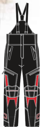
99-52PN100 ROUGE s à 2xl