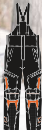
99-52PNORG ORANGE s à 2xl