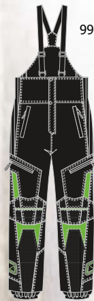
99-52PN500 VERT s à 2xl