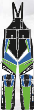
99-51PN524 VERT/ROYAL avec garniture BLANCHE s à 2xl