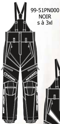
99-51PN000 NOIR s à 3xl