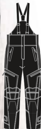
99-52PN000 NOIR s à 3xl