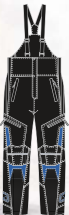
99-52PN200 ROYAL s à 2xl