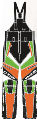
99-51PN054 ORANGE/VERT avec garniture BLANCHE s à 2xl