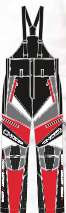
99-51PN100 ROUGE/GRIS avec garniture BLANCHE s à 2xl