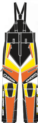
99-51PNOY4 ORANGE/JAUNE avec garniture BLANCHE s à 2xl