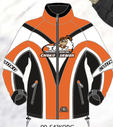
99-54JKORG ORANGE xs à 2xl